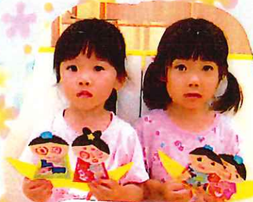
願い事が 叶いますように！