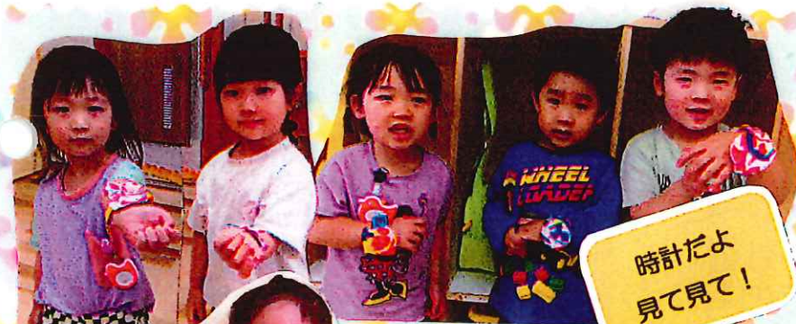
時計だよ 見て見て！