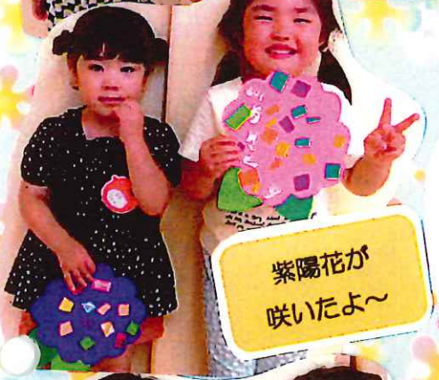
紫陽花が 咲いたよ～