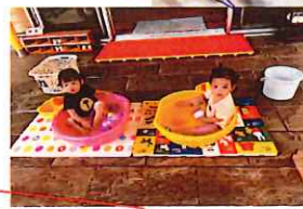
真剣な表情でカメラ目線じゃね