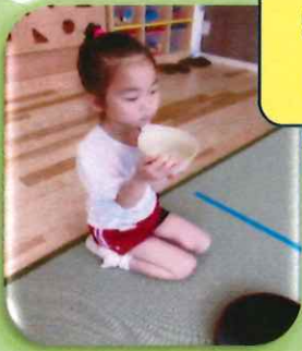
いっぶくさしあげます 🍌

★ 気温も高くなり汗をかくことが増えてきたので、プール後はきれいな服に着替えたいと思います。プールバッグの中に着替え用の服と肌着を入れておいて下さい。