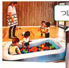
つぼみの部屋は広々して動きまわれるんよ