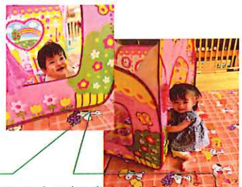
このテントハウスなかなかえんよ