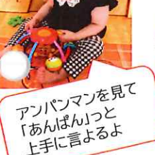
アンパンマンを見て「あんばん」って上手に言よるよ