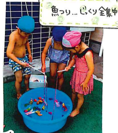
魚っり... じゅんけん全集中