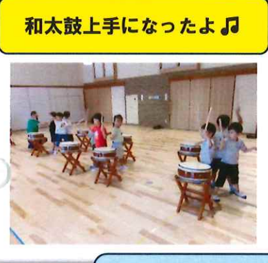
和太鼓上手になったよ 🎵