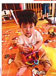
暑い日はコレ最高