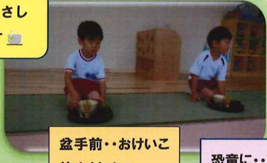
盆手前・・・おけいこ始めました