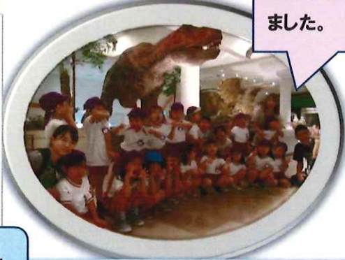
恐竜に・・・びっくり！！楽しい思い出ができました。