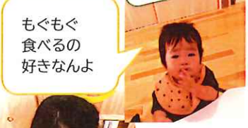
もぐもぐ食べるの好きなんよ