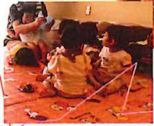
保育士の歌う歌(たまには昭和の歌謡曲(笑))をじーっと見て、聴いてくれよんよ