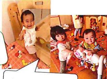
たっちして嬉しんじや