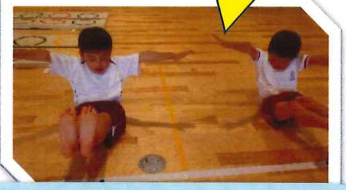
体操教室も頑張ってます！