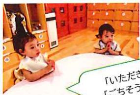
「いただきます」「ごちそうさま」を手を合わせてしょんよ

今月で紙面でのクラスだよりは、おしまいです これからは コードモン からの配信が中心となります。 先週から、あゆみ帳も コードモン での配信となっておりますが、どうですか？ 近々お家からの食事、睡眠、様子等も コードモン を通じてとなりますよ。 デジタルな時代になってきてますよね~(。^)