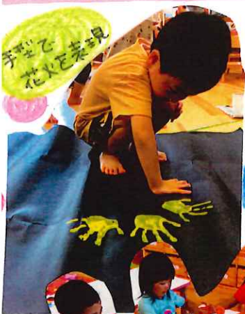
手型で 花火を表現