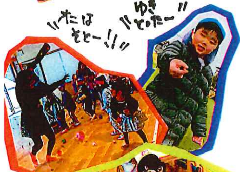
「おは せー!!」 「ゆき とおー!!」