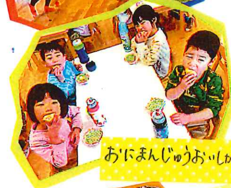
おにまんじゅうおっしから!