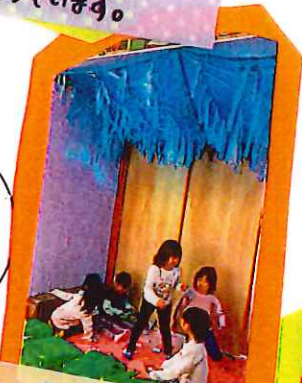
大川コーナーが落ち着くよ