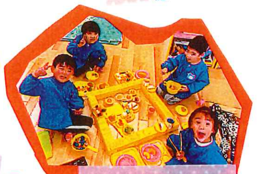
おままごとが大ブームなんですよ。