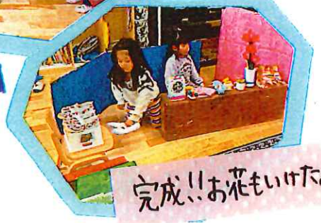
完成!!お花もいけたよ。