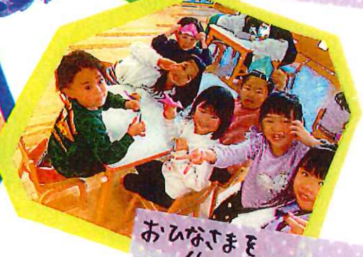
おひなさまを 作っています。