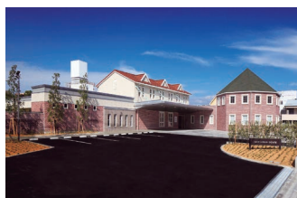
訪問介護 定期巡回・随時対応型訪問介護看護

〒 792-0017 新居浜市若水町一丁目 9 番 13 号 TEL : (0897) 31 - 5022 FAX : (0897) 31 - 5005