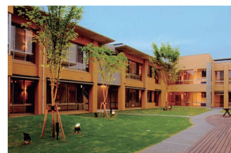
軽費老人ホーム (ケアハウス)

〒 792-0025 新居浜市一宮町二丁目 6 番 72 号 TEL : (0897) 31 - 3222 FAX : (0897) 31 - 3400