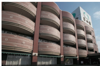
介護老人福祉施設 (特別養護老人ホーム)