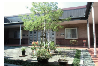
高齢者専用賃貸住宅

〒 792-0805 新居浜市八雲町 8 番 24 号 TEL : (0897) 35 - 1008 FAX : (0897) 37 - 5151