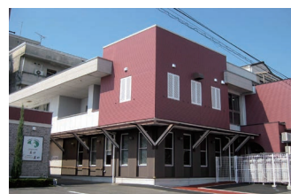
在宅介護支援センター

〒 792-0017 新居浜市若水町二丁目 4 番 38 号 TEL : (0897) 35 - 3008 FAX : (0897) 35 - 3009