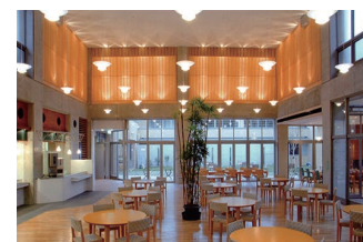
通所介護 (デイサービス)

〒 792-0025 新居浜市一宮町二丁目 6 番 72 号 TEL : (0897) 31 - 3377 FAX : (0897) 31 - 3400