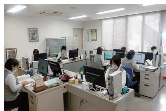
居宅介護支援事業所

〒 792-0025 新居浜市一宮町二丁目 6 番 72 号 TEL : (0897) 31 - 3223 FAX : (0897) 31 - 3400