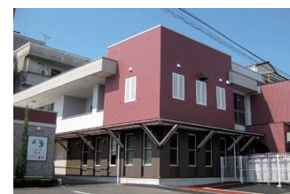
住宅型有料老人ホーム

〒 792-0017 新居浜市若水町一丁目 7 番 6 号 TEL : (0897) 65 - 1700 FAX : (0897) 65 - 1701