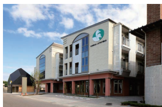
介護老人福祉施設 (特別養護老人ホーム)

〒 792-0017 新居浜市若水町一丁目 7 番 6 号 TEL : (0897) 65 - 1710 FAX : (0897) 65 - 1701