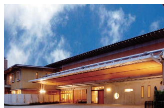
認知症対応型共同生活介護 (グループホーム)

〒 792-0025 新居浜市一宮町二丁目 6 番 72 号 TEL : (0897) 35 - 3000 FAX : (0897) 31 - 3400