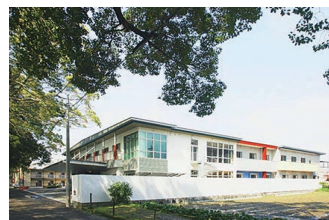
介護老人福祉施設 (地域密着型特別養護老人ホーム)

〒 792-0025 新居浜市一宮町二丁目 6 番 72 号 TEL : (0897) 31 - 3232 FAX : (0897) 31 - 3400