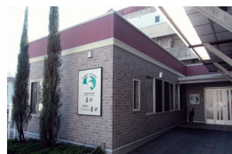
小規模多機能型居宅介護

〒 792-0017 新居浜市若水町一丁目 7 番 6 号 TEL : (0897) 34 - 6813 FAX : (0897) 65 - 1701