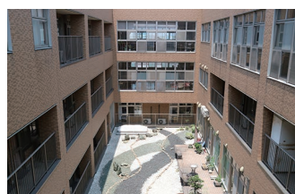
介護老人保健施設 (老人保健施設)

〒 792-0017 新居浜市若水町一丁目 9 番 13 号 TEL : (0897) 31 - 2155 FAX : (0897) 31 - 2066