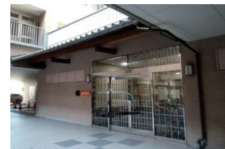
通所リハビリテーション (デイケア)

〒 792-0017 新居浜市若水町一丁目 9 番 13 号 TEL : (0897) 31 - 3000 FAX : (0897) 31 - 3313